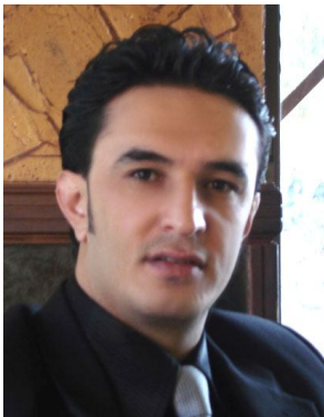
كاروان نە جەمەدىن

ئىمە بانگەوازانى شۆرشىن ، زەمانىكە بانگەوازي شۆرش ئەكەين ، ئەمرو شۆرش شىكلى گرتوۋ و ئەمرو ئەو شۆرشە بانگەوازان ئەكات ، بانگەواز ئەكات كە پىخراۋى بىكەين ، يەكگرتوى بىكەين ، پابەرايەتى بىكەين و بە سەركەوتنى بگەينەين ، ئەم كۆنگرەيە تەواۋى ھەدەف و ئەركو كارى كە ئەبىيەت لەم دوو پوژەدا ئەنجامە بدات ئەوئەيە كە وەلامى ئەم بانگەوازي خەلك بداتەو ، خەلك بانگەوازي ئىمە ئەكەن بۇئەو ھى شىعارەكانيان پوژىش بگەينەو ، پىخراۋايانەكەين ، پابەرايەتتە بىكەين و سەريانەكەين ، ئەم كۆنگرەيە ئەبىيەت وەلامى ئەم بانگەوازي بداتەو و من گومانم نىە كە ئىمە بە سەركەوتوانە كۆتايى بە كۆنگرە بىنەين و وەلامى راست و دروست بەم بانگەوازي كۆمەلگە ئەدەينەو .